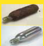
ボンベ使用 済み・サビ