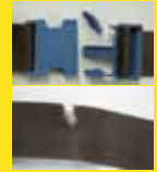
バックル・ ベルト破損