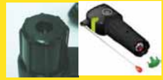
スプール・カートリッジ 使用期限切れ